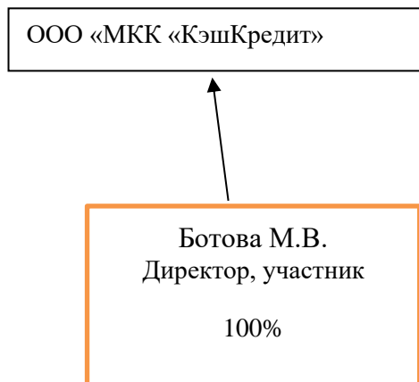
Схема взаимосвязей ООО «МКК «КэшКредит» и лиц, оказывающих существенное (прямое или косвенное) влияние на решения, принимаемые органами управления ООО «МКК «КэшКредит»

к Положению о раскрытии неограниченному кругу лиц информации о лицах, оказывающих существенное (прямое или косвенное) влияние на решения, принимаемые органами управления микрофинансовой организации ООО «МКК «КэшКредит»